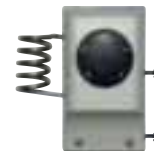
Thermostat étanche 0501-21

Colisage : emballage carton sur palette * jusqu'à épuisement des stocks