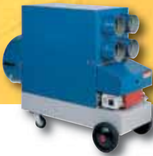
Exemple : chapiteau